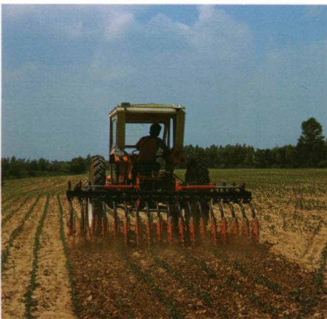
In lavorazione su soia / Working on soya.

consequent ground crust crumbing, without causing any damage to the plant. Suitable for soya, Indian corn, beet, wheat, tobacco, cereals and vegetables.