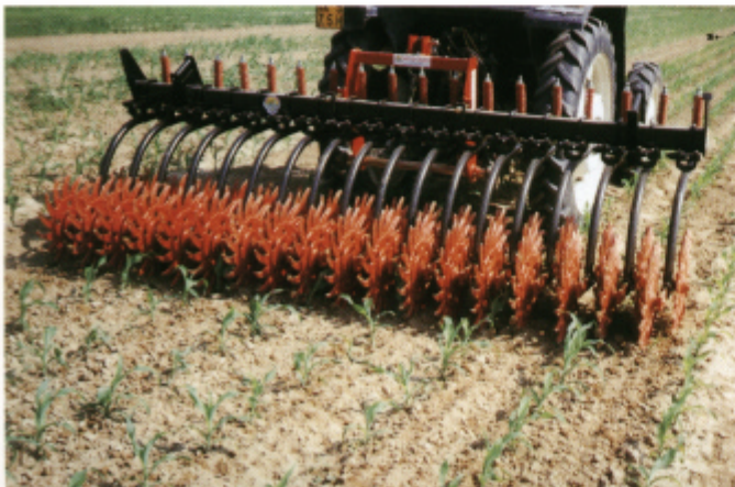
In lavorazione su mais / Working on Indian corn.

La zappa rotativa, nota con il nome di "rompicrosta" consente una serie di varie operazioni veloci ed indispensabili per una buona lavorazione del terreno. Prepara il letto di semina rompendo la crosta superficiale formatasi dopo l'epicatura. Dopo la semina rompe la crosta che impedisce e ritarda la nascita del seme. Ossigena e umidifica in modo uniforme il terreno, ne facilita la crescita fortificando le piante e rendendole più