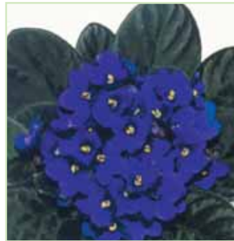
Ballet EL Rana