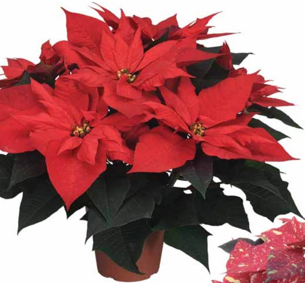
PLA Primero Red®