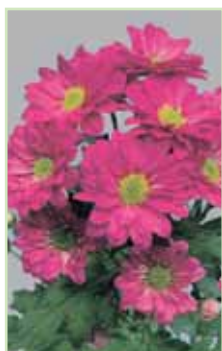
Reagan Dark Splendid®