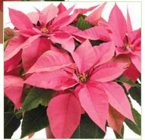
PLA Classic Pink®