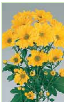
Reagan A. Elite Sunny®