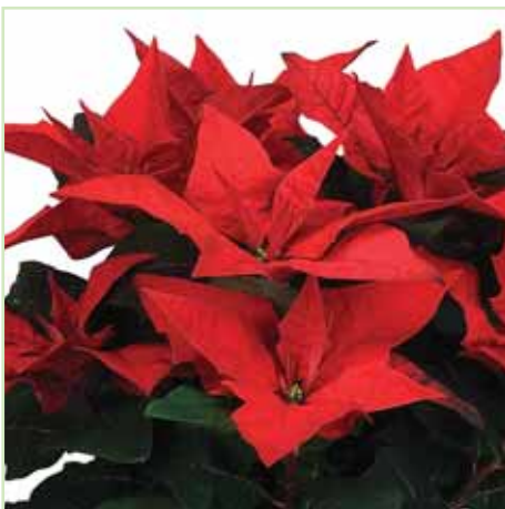
PLA Jester Red®