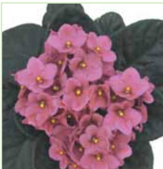
Ballet EL Salmon