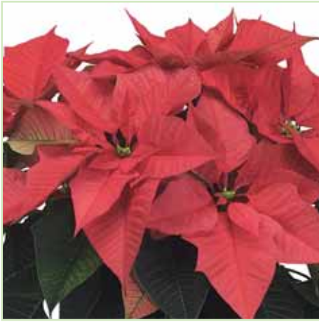
PLA Freedom Salmon®