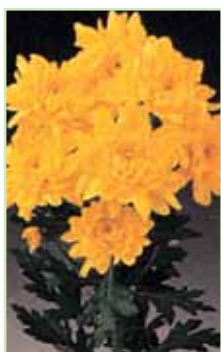
Fiji Bright Sunny®