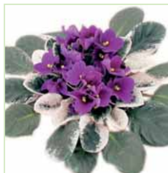
Ballet EL Artic Lila