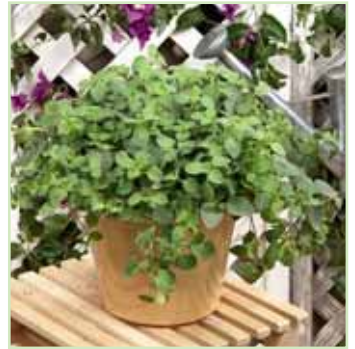
Origanum vulgare Hot & Spicy