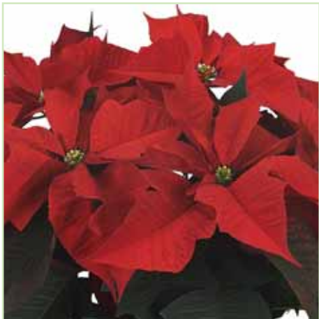
PLA Monreale Early Red®