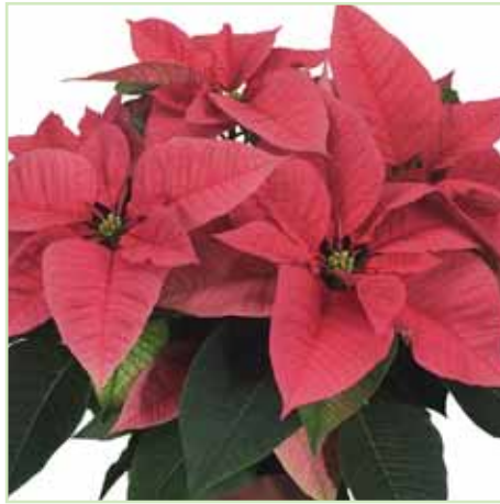
PLA Freedom Early Pink®