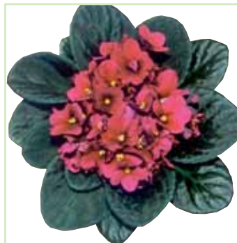
Ballet EL Shannon