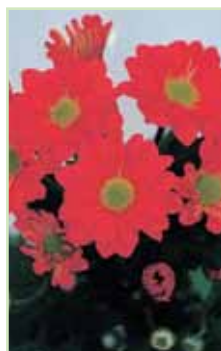
Reagan Ruby Red®