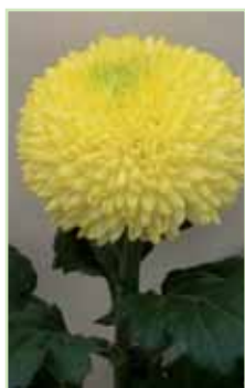
Boris Becker Sunny®