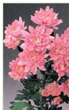
Fiji Dark Pink®