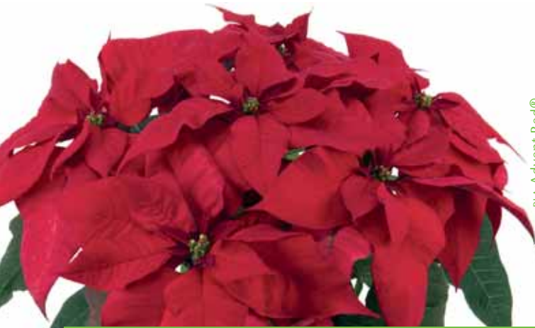
PLA Advent Red®