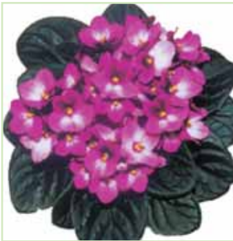
Ballet EL Patty