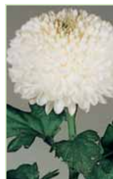
Ping Pong Super