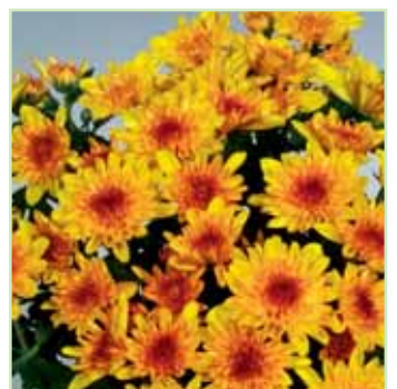
New York Dazzling®