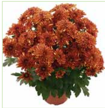
New York Bronze®