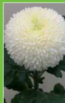
Boris Becker White®