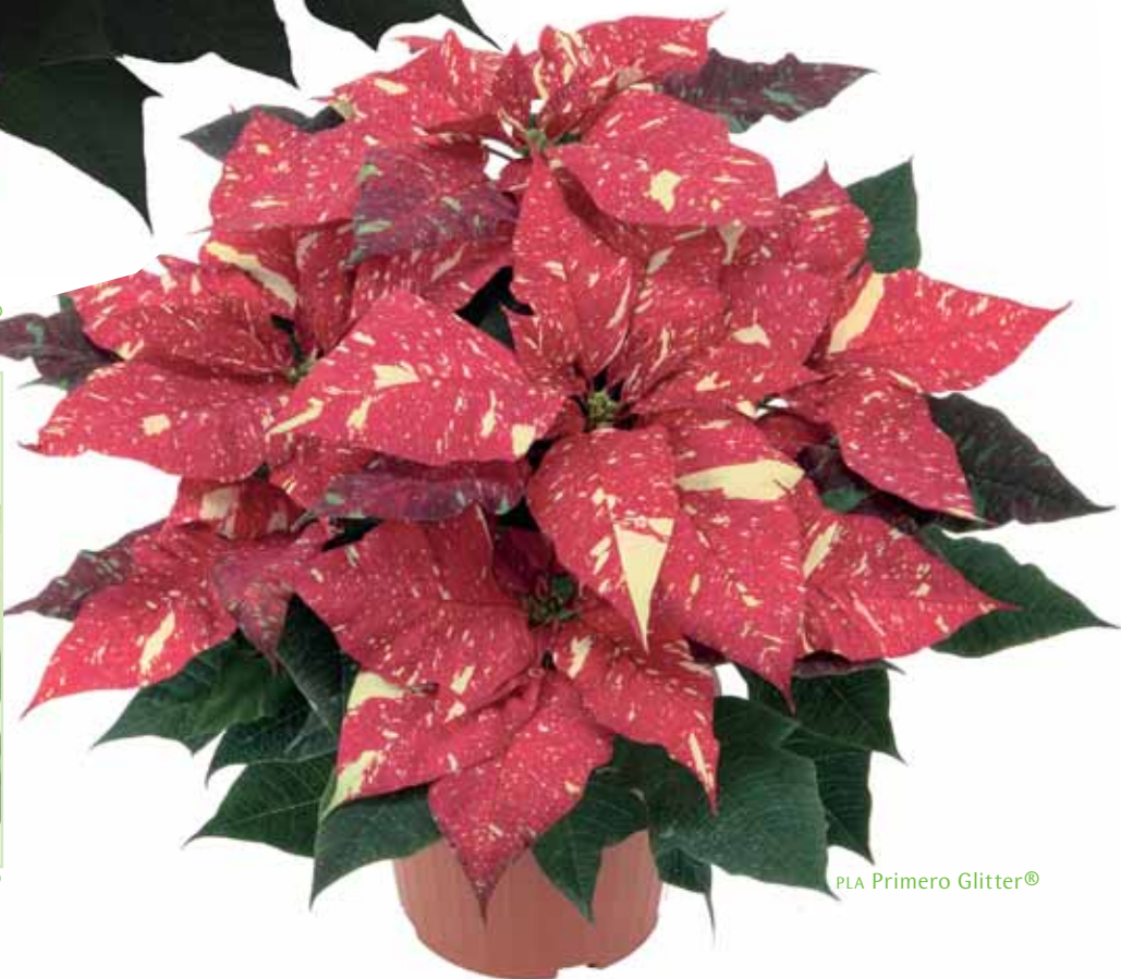
PLA Primero Glitter®