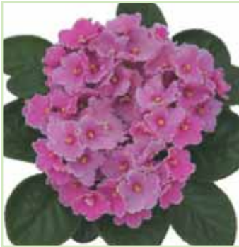
Ballet EL Dorothy