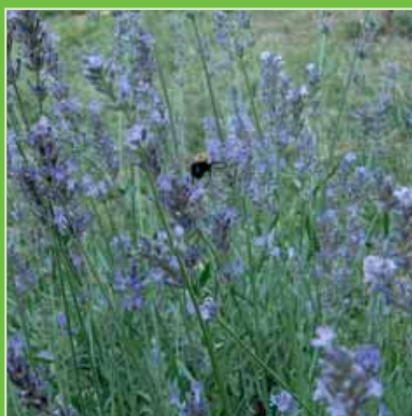
Lavandula x intermedia Vera