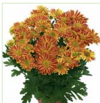
Lake Worth Dark®