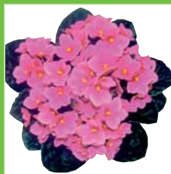
Ballet EL Cilly