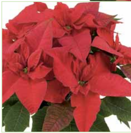
PLA Classic Red®