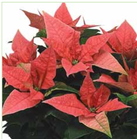
PLA Jester Pink®