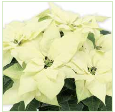
PLA Primero White®