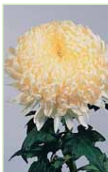
Fred Shoemith White