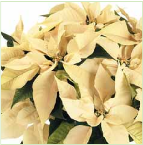
PLA Classic white®