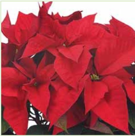
PLA Freedom Red®