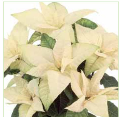
PLA Jester White®