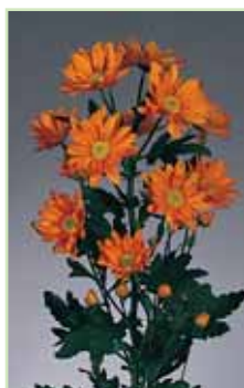
Reagan A Elite Orange®