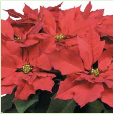
PLA Freedom Fireworks®