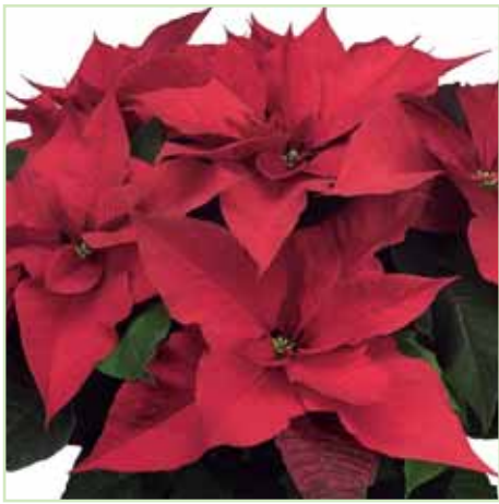
PLA Prestige Red®