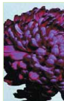
Inc. Sheer Purple