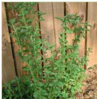
Stevia rubaudiana compact