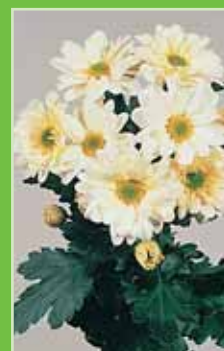
Reagan A. Elite White®