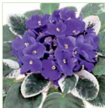
Ballet EL Artic Blue