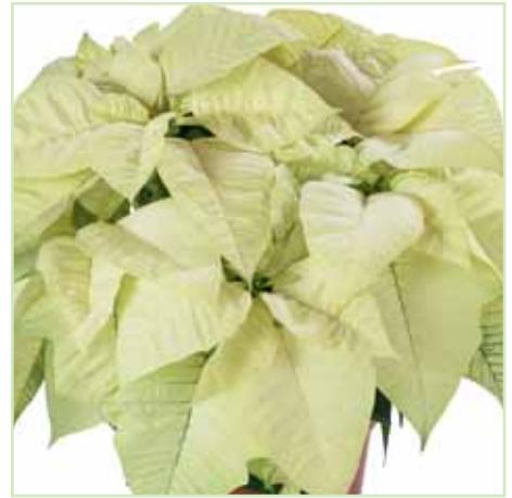
PLA Freedom Early White®