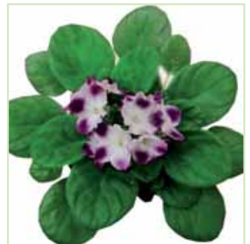
Ballet EL Tia