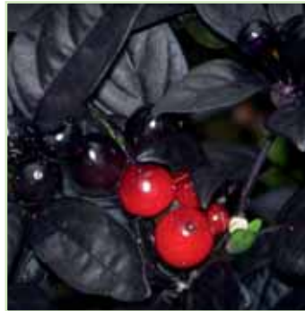
Piper nigrum Pepe nero®