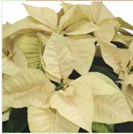
PLA Freedom White®