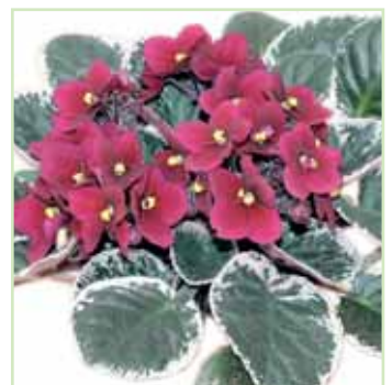
Ballet EL Artic Red