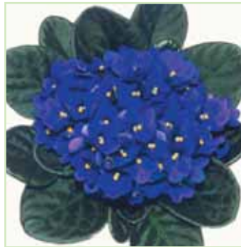
Ballet EL Paula