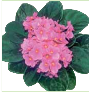
Ballet EL Inga