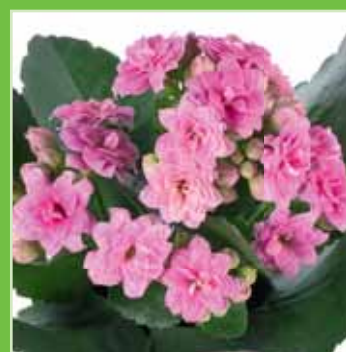
Calandiva Pink Cadillac®