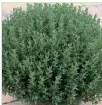
Thymus vulgaris Precompa