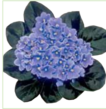
Ballet EL Margret