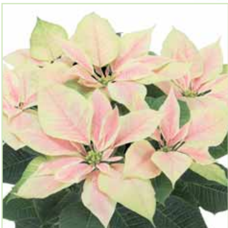
PLA Primero Marble®