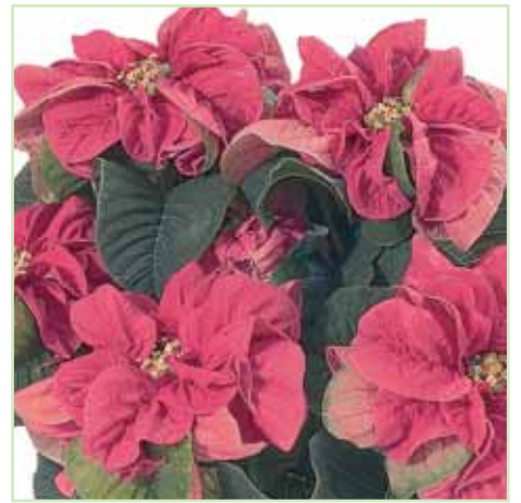
PLA Winterrose® Early Pink®