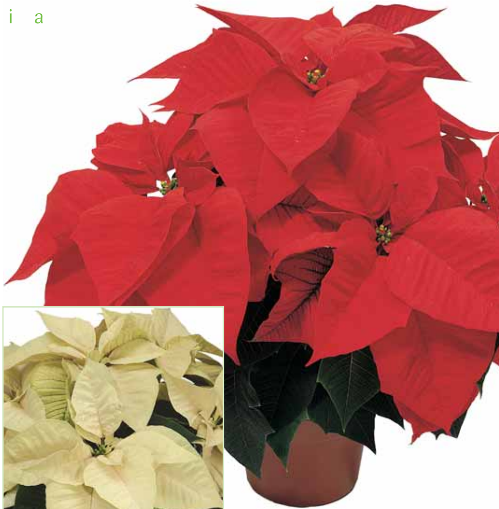
PLA Freedom Early Red®