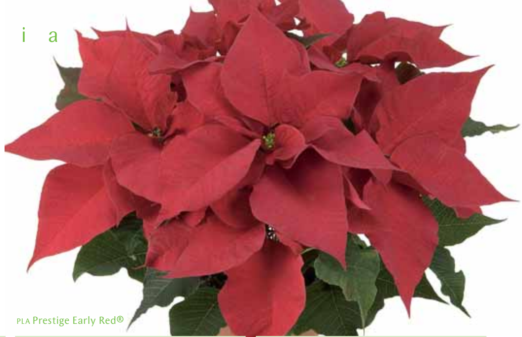
PLA Prestige Early Red®