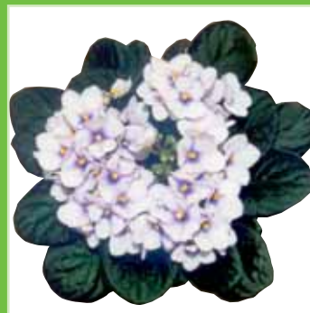
Ballet EL Blue Flame