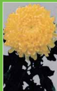
May Shoemith Yellow®