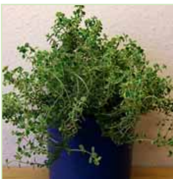
Thymus citrodora Lemon Supr.