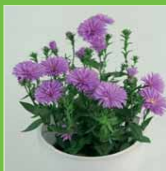
Pink Fanny ®