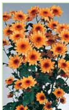
Le Mans Sunny®