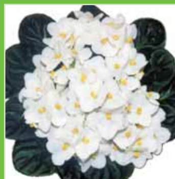
Ballet EL Claudia