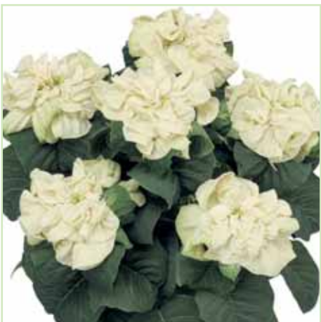
PLA Winter Rose® Early White®