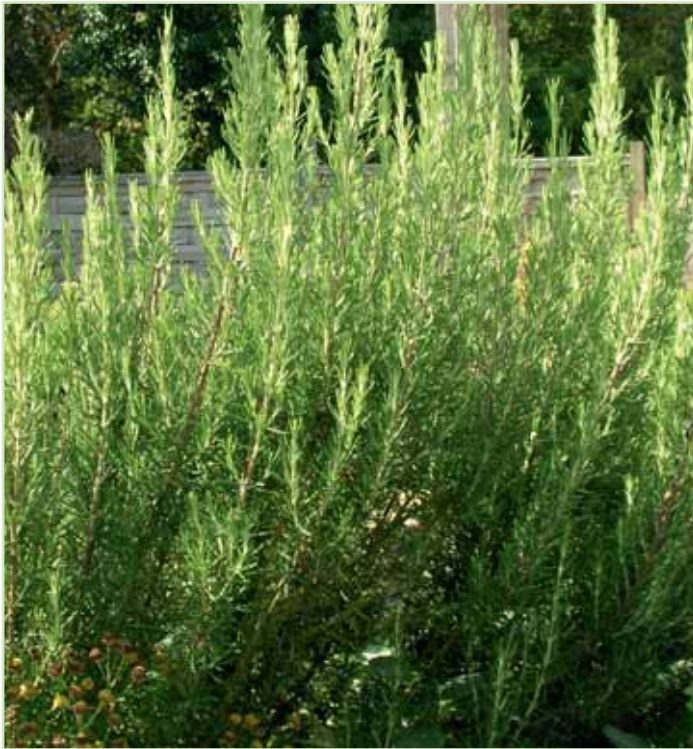
Rosmarino off. Upright Blue