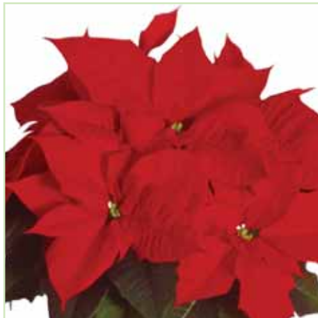
PLA Roman Red®