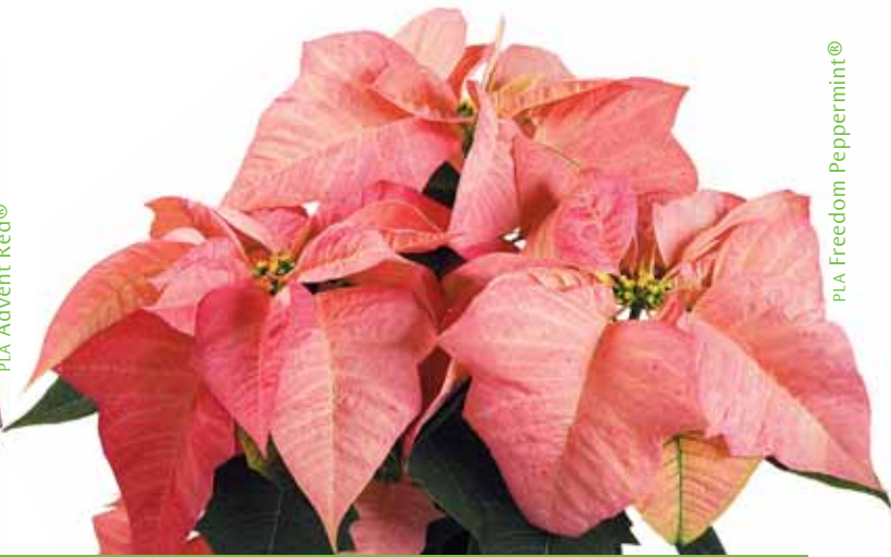
PLA Freedom Peppermint®