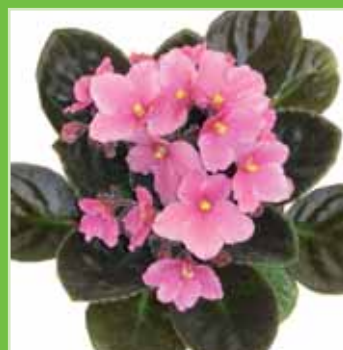
Ballet EL Cilia