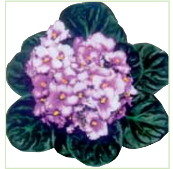
Ballet EL Mia