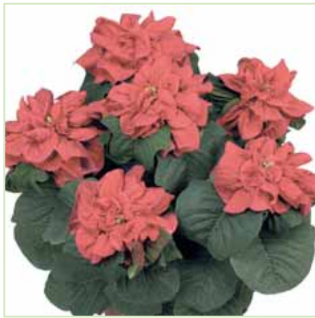
PLA Winter Rose® Early Red®