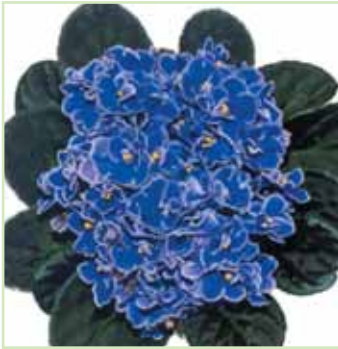
Ballet EL Ina