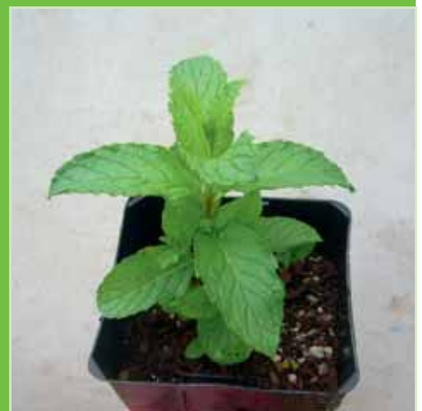
Mentha spicata Moroccan