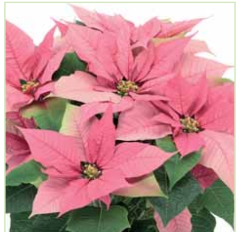
PLA Primero Pink®