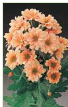
Reagan A Elite Salmon®