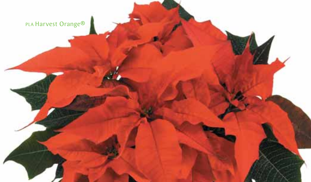
PLA Harvest Orange®