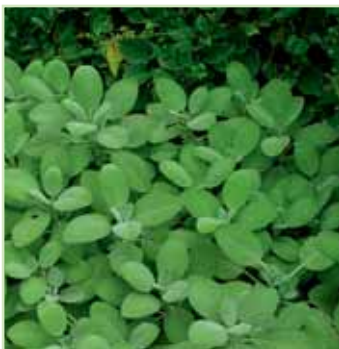
Salvia Growers Friend