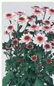
Le Mans Pink®