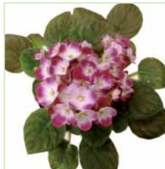
Ballet EL Tina