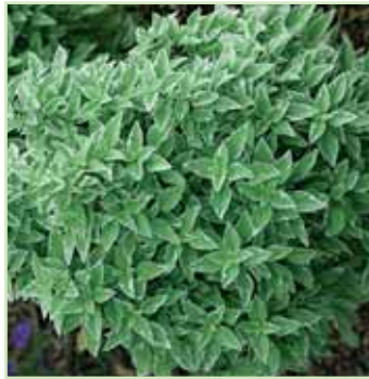
Ocimum basillicum x citriodorus Kalisto