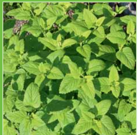
Melissa officinalis Lemon Balm