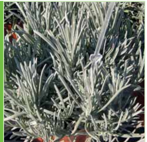
Lavandula x intermedia Grosso