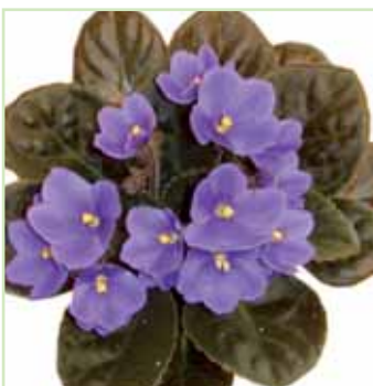
Ballet EL 361-1