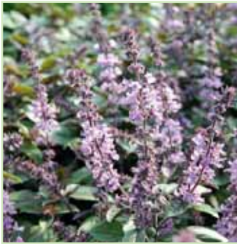
Ocimum basillicum Magic Mountain