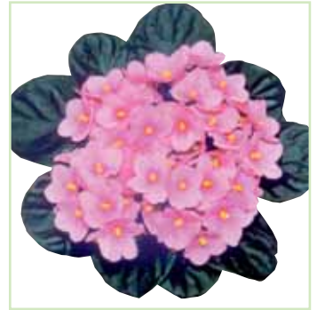
Ballet EL Heidrun